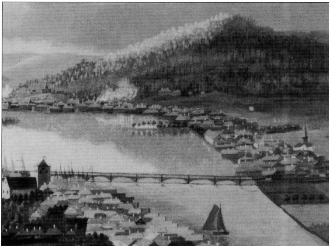
Utsnitt av maleri av H. P. C. Dahm fra ca 1820. Vi ser den hvite tollboden på en holme utenfor Strømsø.

- trolig i 1799 -, måtte han la kone og barn bo på landet hvor det var billigere.