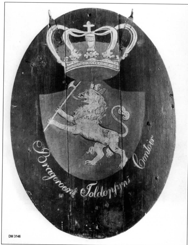
Skilt fra Bragerøens Toldopsyns Contoir.